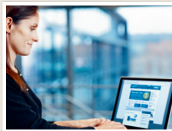
Rådgivning via Företagskontoret Online

Hos oss får du också rådgivning kring din privatekonomi, till exempel med sparande, bolån, pension och försäkringar.